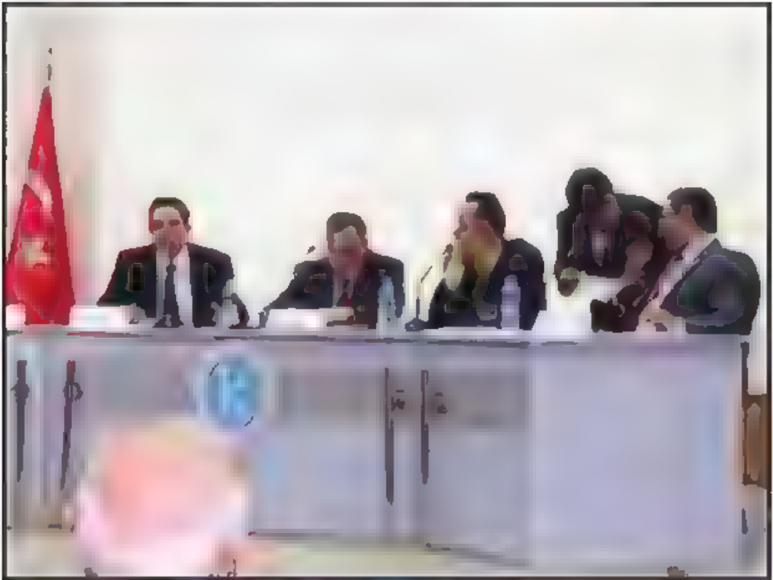
İkinci Oturum – Türk Dış Politikasında Doğu